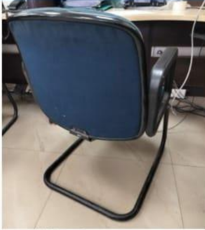
1. बाँयी छवि (Left Image)