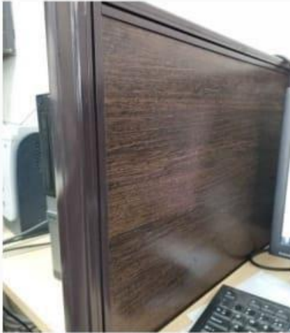
3. सामने की छवि (Front Image)