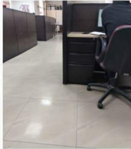
4. पीछे की छवि (Back Image)

Disclaimer: सम्पत्ति की फोटो पूर्णतः वास्तविक होनी चाहिये | गलत सम्पत्ति की फोटो अपलोड करना दंडनीय अपराध हैं | सम्पत्ति की फोटो नकली अथवा अस्पष्ट पाये जाने पर सम्पत्ति का पंजीयन रद्द हो सकता हैं |